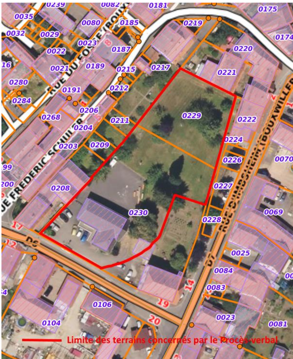
Parcelles 229 et 230 de la section 4 du cadastre de Bouxwiller (67330).